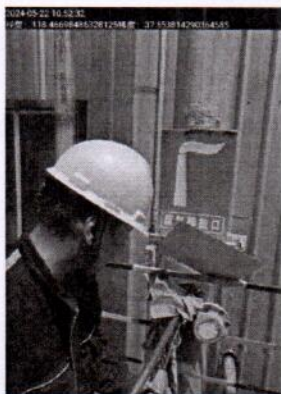
附件一：现场采样照片