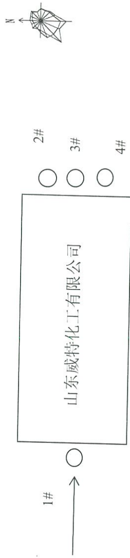
图 3-1 11 月 22 日无组织废气检测点位分布图